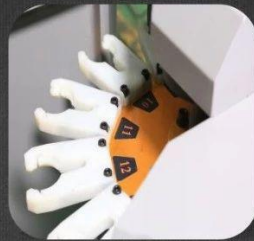
在设计上增加了12个刀库